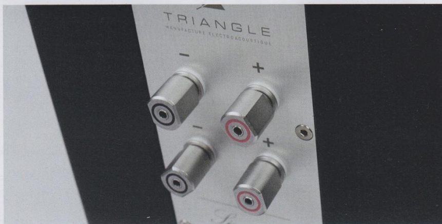
Das massive aus Aluminium gefertigte Bi-Wiring-Terminal der Australe ist sehr solide verbaut

mäßige Ausstattung mit einer 2 Terabyte-Festplatte vollkommen in Ordnung geht. Wird eine CD ins Laufwerk geschoben, so rippt das Gerät diese automatisch, es sei denn, das Laufwerk ist bereits als Signalquelle ausgewählt. In diesem Falle wird die CD bloß wiedergegeben. Was dem einen ein zu hohes Maß an Selbständigkeit ist, ist dem anderen eine willkommene Erleichterung. Denn außer dem Wechseln des Datenträgers muss nichts weiter getan werden, um beim abendlichen Film gemütlich die CD-Sammlung zu digitalisieren. Sämtliche Metadaten bezieht das Gerät ebenfalls ohne menschliches Zutun von MusicBrainz, einer freien „Musik-Enzyklopädie“. Laut Hersteller dauert das Importieren einer CD im Schnitt zehn Minuten, dies ist freilich abhängig von der Menge und der zu erfassenden Daten. Die gesamte Festplatte kann natürlich