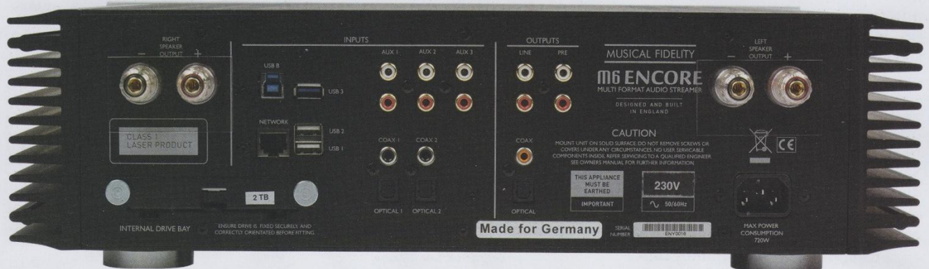
Alles, was das Herz begehrt: Ausreichend Eingänge und Stereo-Ausgänge für Lautsprecheranschlüsse machen aus dem M6 Encore ein echtes All-In-One-System. Außerdem hier zu sehen: die austauschbare 2 Terabyte-Festplatte

Wenn wir mal ehrlich sind, so steht und fällt die Qualität eines Wiedergabesystems mit dessen Benutzerfreundlichkeit. Gerade bei einem All-In-One-System wie dem M6 Encore kann die verbaute Technik noch so exzellent sein – wenn die Bedienung zu umständlich oder gar instabil ist, wird das Gerät keine Lorbeeren ernten. Die Steuerung durch ein mobiles Endgerät, sei es das Smartphone oder ein Tablet, muss intuitiv funktionieren und im besten Falle sogar Spaß machen. Was Musical Fidelity mit der App zum M6 Encore gelungen ist, vermag tatsächlich alles bisher Dagewesene in den Schatten zu stellen. Nicht nur, dass die Oberfläche grafisch einladend aufgearbeitet ist und sich kinderleicht Wiedergabelisten aus den Streamingdiensten Tidal, Spotify und Qobuz und natürlich der Bibliothek auf der Festplatte erstellen und abspeichern lassen, bereitet Freude. Vor allem die unzähligen Extras, welche die App bereithält, sind ohnegleichen. So kann man sich während der Wiedergabe direkt Songtexte anzeigen lassen, technische Metadaten wie Abtastrate und Bit-Tiefe erfahren und direkt den Wikipedia-Artikel des Interpreten durchstöbern