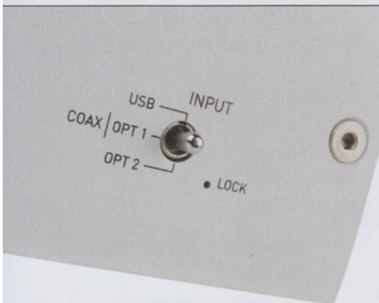
Ein niedlicher kleiner Kippschalter schaltet die Quellen um