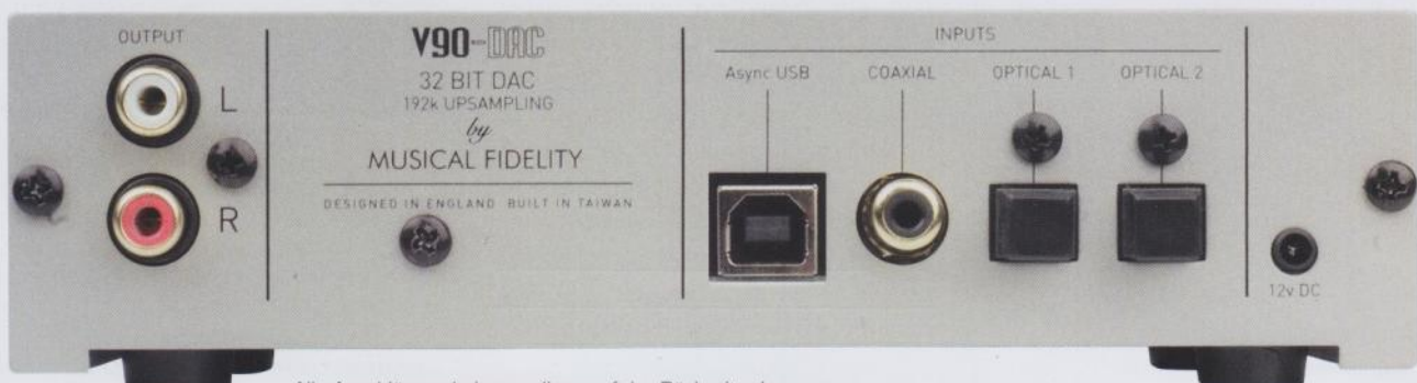
Alle Anschlüsse sind neuerdings auf der Rückseite des Geräts, die USB-Verbindung arbeitet asynchron bis 96 kHz

Die erfreuliche Preisgestaltung lässt natürlich Fertigung in Fernost vermuten. Das ist auch so, die V90-Serie wird in Taiwan gebaut. Aus meiner Erfahrung heraus kann ich nur sagen, dass alles, was auf dieser Insel entstand