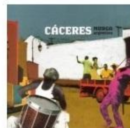
Eine fantastische Aufnahme mit rauchiger Stimme und authentischer Tango-Atmosphäre: Carlos Caceres „Muros Argentina“ (Cover: Amazon)