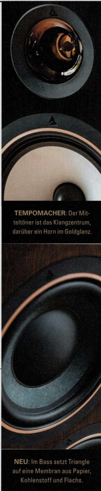
TEMPOMACHER: Der Mitteltöner ist das Klangzentrum, darüber ein Horn im Goldglanz.

Einer der ersten Lautsprecher der Company war ein Breitbänder. Mit demselben Ansatz geht das Team bis heute vor: Der Mitteltöner übernimmt ein erstaunlich breites Spektrum des Frequenzgangs. Vier Oktaven sind für diesen Mitteltöner reserviert. In techni-