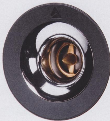
▲ Präzision, Tempo und Wirkungsgrad machen den Triangle-Hochtöner zum Ausnahmetreiber.

Das geht zweifellos auf das Konto genannten Ausnahmetreibers, zudem ist die Triangle mit fast 93 dB bei 2,83 Volt Eingangsspannung die