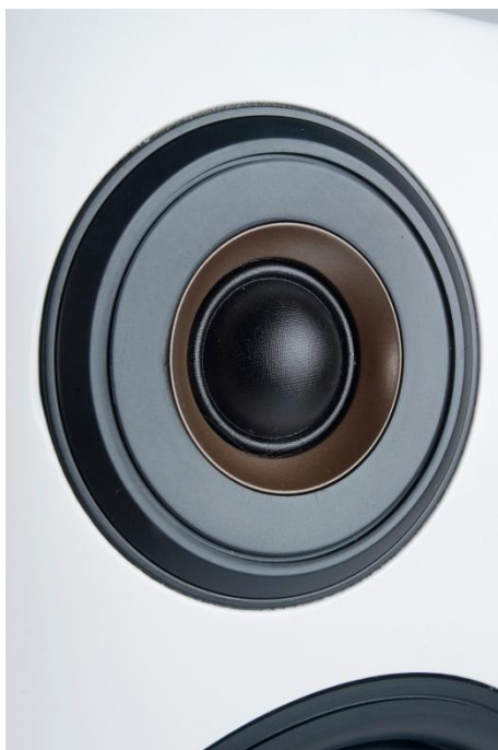
Der Hochtöner setzt nicht nur einen optischen Akzent, seine Einfassung ist akustisch optimiert