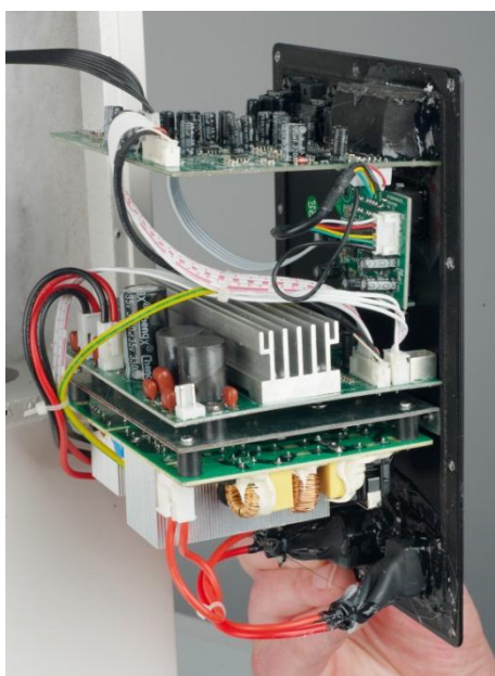
Die moderne Elektronik enthält eine Class-D Zweikanalendstufe und eine aufwendige Signalverarbeitung mit DSP und Phonostufe

Konkret steigt der untere Bass bei etwa 1 kHz aus, während der obere bis ca. 2,5 kHz an den Hochtöner übergibt. Im Gegensatz zu manchem anderen Hersteller lässt Triangle die beiden zierlichen Bässe möglichst weit parallel laufen – warum Schalldruck verschenken, gerade, wenn Membranfläche nicht im Überfluss vorhanden ist.