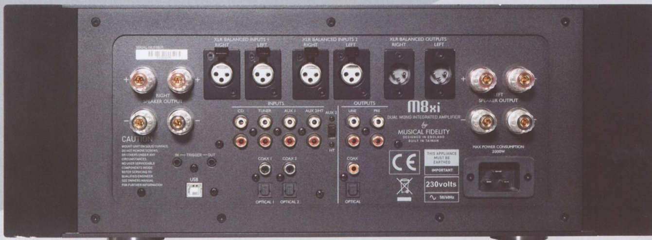
Der M8xi weist mehr als ausreichend Ein- und Ausgänge auf. Die zwei mal zwei Lautsprecher-Anschlüsse sind für Bi-Wiring ausgelegt bzw. den Anschluss von vier Lautsprechern

den. Die auf Kraft und Durchsetzungsvermögen optimierte Schaltung ist der Grund dafür, dass der Verstärker insgesamt mehr „Wums“ hat. Denn tatsächlich sorgt der Vorverstärker für den kraftvollen Auftritt eines Vollverstärkers – hapert es hier, wird das die Endstufe niemals richten können. Die beiden Mono-Blöcke der Endstufe nutzen als Endverstärker-Transistoren hochstabile bipolare Darlington-Paare vom Typ Sanken STD-03N und STD-03P. Damit diese zusammen ein perfektes Stereobild ergeben, werden sie in einem aufwändigen Prozess paarweise ausgewählt. Dass jeder Endverstärkerkanal einen eigenen Transformator hat, der dann wieder jeweils ein separates Netzteil ansteuert, hatten wir bereits erwähnt. Diese Mono-Endstufen arbeiten nach dem Class AB-Prinzip. Wobei wir hier schon verraten können, dass sie wie Class-A-Endstufen klanglich in Erscheinung treten.