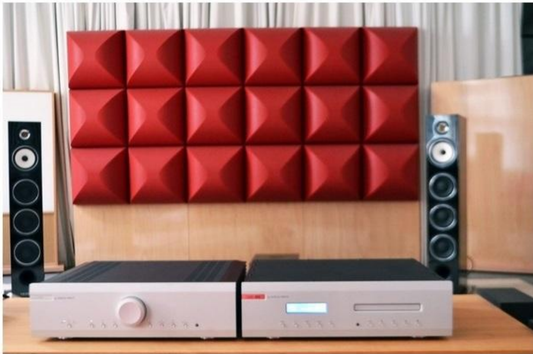
Musical Fidelity M6si im LowBeats Hörraum mit CD-Player M6scd und den überragend gut passenden Triangle Standboxen Autrale EZ

Das unglaublich dynamische „Crying“ aus James Blood Ulmers Album Live im Bayerischen Hof klang mit dem M6si noch authentischer, lebendiger und vor allem mitreißender. Dieser Verstärker macht nicht wirklich viel Glanz, aber fast alles richtig.