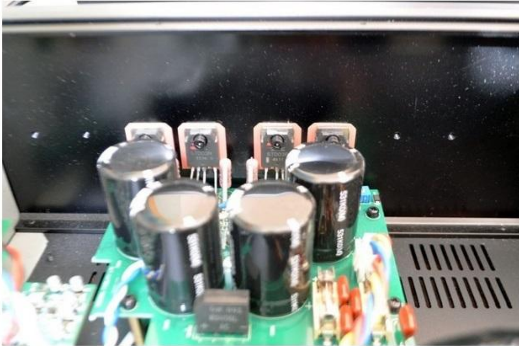
Eines der beiden Endstufen-Module mit 2 Pärchen Sanken-Transistoren sorgen für die stattliche Leistung

Seine Leistung von knapp 300 Watt sinus pro Kanal an 4 Ohm bezieht der M6si aus jeweils zwei Pärchen Sanken Bipolar-Transistoren STD03N (NPN) plus STD03P (PNP) – das gleiche Konzept wie beim kleineren M5si also. Anthony Michaelson hat auch nie ein Hehl daraus gemacht, dass sich die beiden Verstärker in diesem Punkt sehr ähnlich sind. Die erkennbar höhere Leistung des M6si von 70 Watt generiert der Große aus seiner höheren Netzteilstabilität.