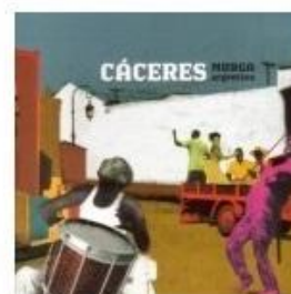
Eine fantastische Aufnahme mit rauchiger Stimme und authentischer Tango-Atmosphäre: Carlos Caceres „Muros Argentina“