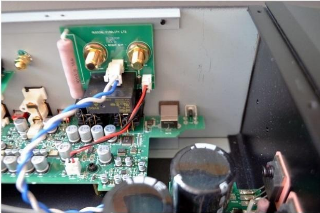
Die Phonostufe des M6si

Erwähnenswert ist auch die Home-Theatre-Funktion des einen AUX-Eingangs: Über einen Jumper an der Rückseite umgeht der HT-Modus den Lautstärke-Regler des des M6si. So kann man den Vollverstärker und die angeschlossenen Lautsprecher leicht in ein Mehrkanalsystem einbinden, in dem dann der AV-Prozessor die Lautstärkeregelung übernimmt.