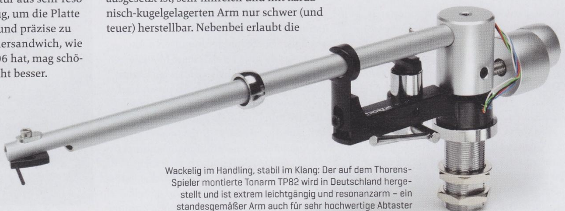
Wackelig im Handling, stabil im Klang: Der auf dem Thorens-Spieler montierte Tonarm TP82 wird in Deutschland hergestellt und ist extrem leichtgängig und resonanzarm – ein standesgemäßer Arm auch für sehr hochwertige Abtaster

Im Umgang mit realen Tonabnehmern erweist sich die Azimuth-Verstellung als Wunderwaffe, die selbst zickigen Nadeln das Zimbeln und Zischeln abgewöhnt. Lange Rede, kurzer Sinn: Uns gefällt der Thorens TD 203 sogar besser als sein großer Bruder 206. Der Einpunkt-Arm schafft mit relativ einfachen Systemen bereits eine verblüffend saubere, geschmeidige und detailreiche Wiedergabe. Dass er nicht ganz die kantige Grobdynamik des 206 bringt, stört angesichts seiner Vorzüge nicht. Nur ein kleines Upgrade haben wir dem Spieler gegeben: Statt des offiziell verbauten MM-Systems TAS257 wird an den 203ern für diese Anlage das hochwertigere, deutlich sanfter klingende TAS267 vormontiert. Das betont den eleganten Flow des kleinen Thorens noch – und macht ihn zum noch harmonischeren Partner für die dynamischen Triangle-Lautsprecher.