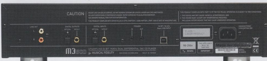
Der CD-Player ist mehr als das Laufwerk. Über USB, optische und koaxiale Wege kann direkt der interne Wandler benutzt werden