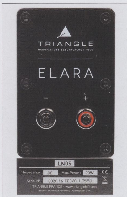
Gut zu erkennen: die Impedanz ist mit 8 Ohm angegeben