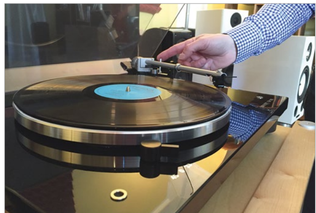
Er erklärt uns die Besonderheiten des Thorens TD 206. Vorn im Bild sieht man die Öffnung zum Justieren der Standfüße von oben