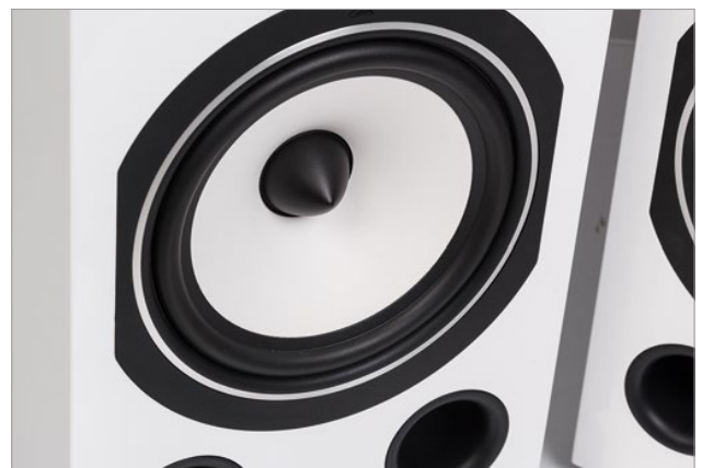
Stilvolles Design – die seitlich beschnittenen aus einer beschichteten Papiermembran gefertigten Mitteltöner