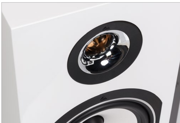
Der hauseigene Hornhohtontreiber mit dem Titaniumtunnel ist das Herzstück des Triangle Esprite Comete EZ

Unsere Anlage runden die Kompaktlautsprecher Comete aus der Serie EZ der französischen Hi-Fi-Schmiede Triangle ab. Triangle kann auf eine ähnlich lange Schaffenszeit zurückblicken, wie seine Mitspieler in unserer Kette. 1980 brachte das im schönen Soissons ansässige Werk sein erstes Produkt auf den Markt – den Standlautsprecher 1180. Die aktuelle Serie EZ beinhaltet ganze sechs Produkte: vom großen Standlautsprecher Antal zur kompakten Surroundsystem-Komponente Voce. Der Comete ist 40 Zentimetern (cm) Höhe,